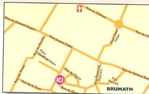
Plate-forme Petite Enfance Maison des Services

Permanences sans rendez-vous : Lundi à Hoerd de 13 h à 17 h Mercredi à Brumath de 9 h 30 à 12 h