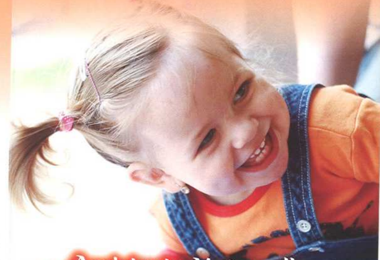
Plate-forme Petite Enfance

Assistante Maternelle, Crèche, Halte Garderie, Baby-sitting ou Structure Périscolaire ?